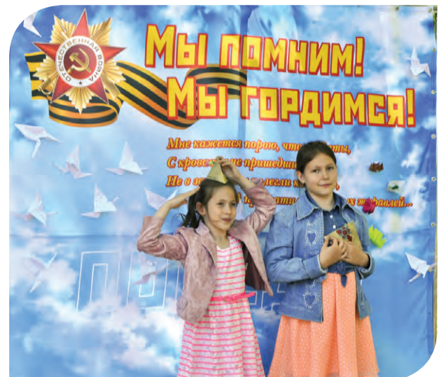
Юные жители Западного административного округа поздравляют ветеранов с Днем Победы