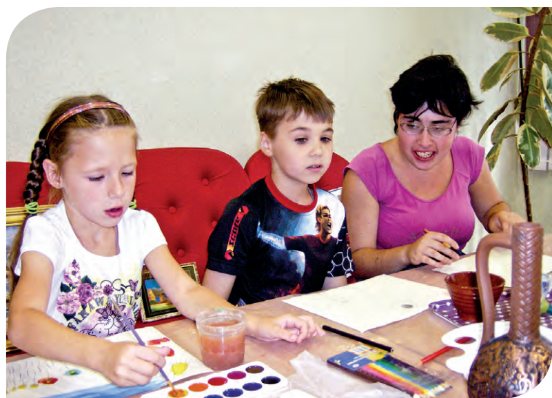
Арт-терапия творит чудеса