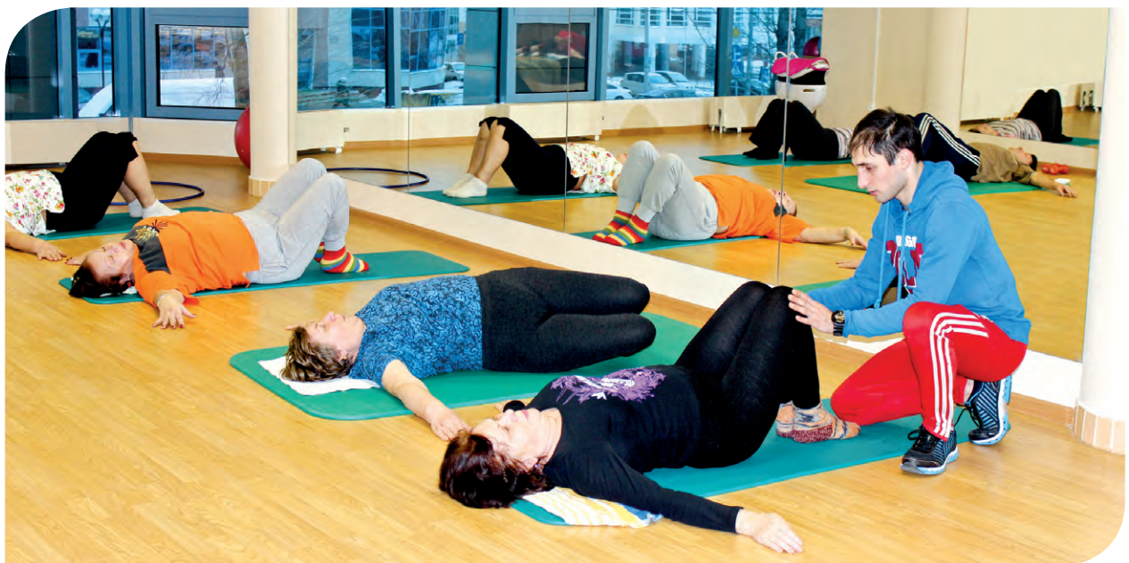
На занятиях ЛФК в ЦСО «Московский»

В прошлом году юным жителям Новой Москвы было оказано более 4 тыс. услуг, включая оздоровительный отдых и предоставление адресной социальной помощи.