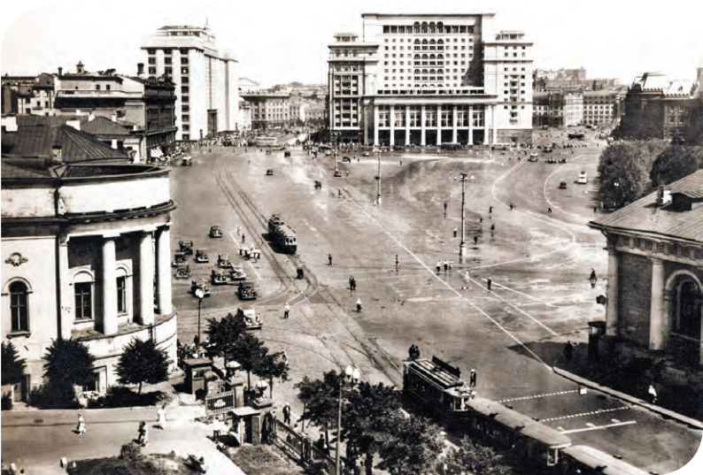
Манежная площадь, 1930-е годы

и на 16 стеклянных пластинах запечатлел круговую панораму Москвы. Преемники Шерера бережно хранили негативные стекла и в более поздние годы использовали их при печати фотографий.