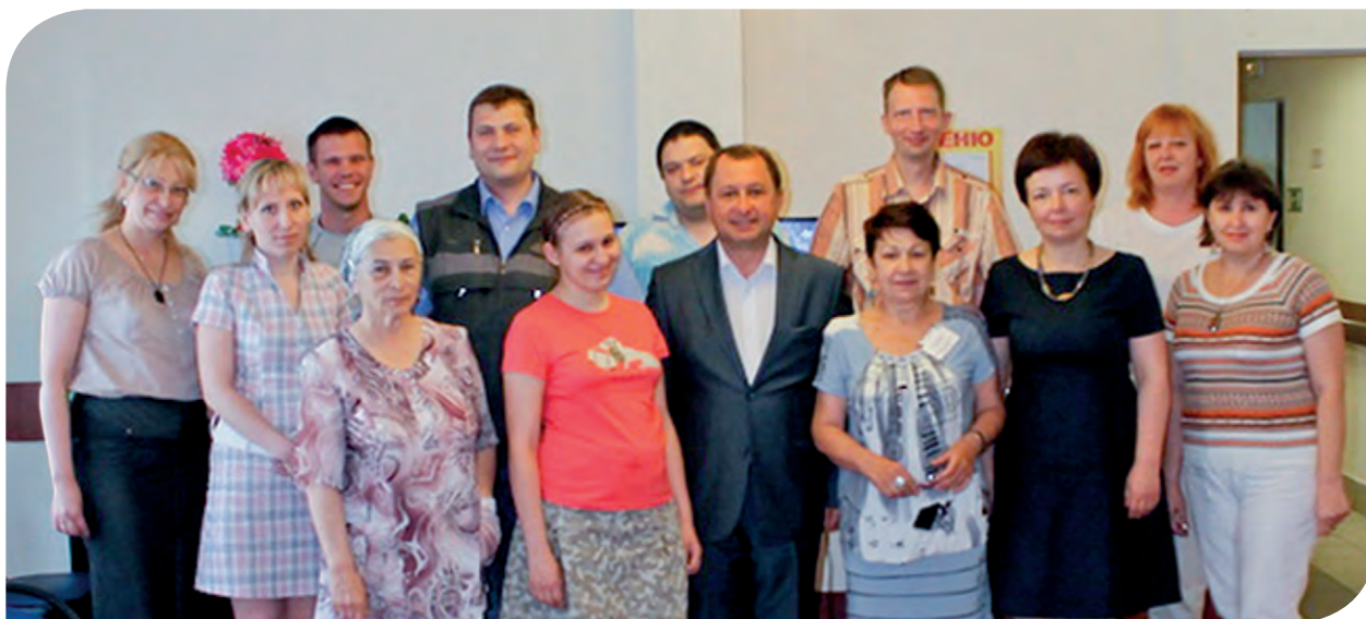
Встреча представителей общественных организаций в ЦСО «Щербинский»

В этом году предстоит разработать и внедрить регламент межведомственного взаимодействия учреждений системы профилактики, организовать многоуровневую систему повышения и обучения кадров.