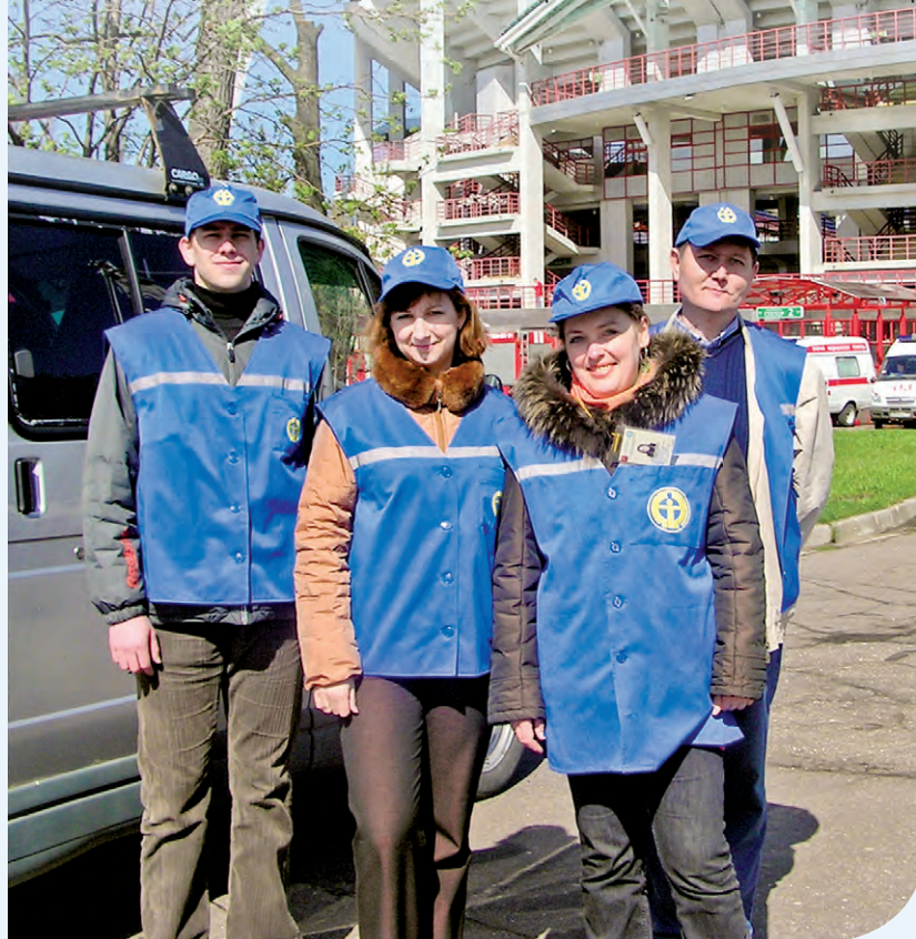
Бригада психологов быстрого реагирования при чрезвычайных ситуациях

По дороге на работу рассеянно пролистывала свежий номер