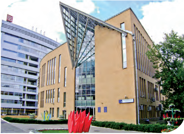
Московский Дом ветеранов войн и Вооруженных Сил

тронажной сестрой, потому что ее, как многодетную маму, устраивал свободный график работы, да и младшая дочь подрастала. Девочка окончила школу, получила среднее специальное, а затем и высшее образование. Сейчас она работает в Службе по работе с ветеранами, имеющими особые заслуги перед Отечеством: и мама, и дочь посвящают себя общему благородному делу.