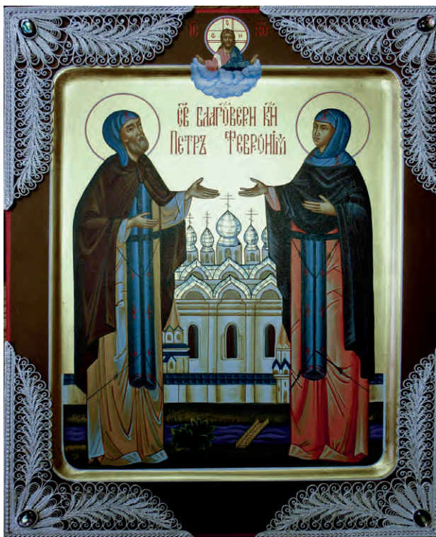
Икона святых благоверных Петра и Февронии Муромских

мальчика. Мы ездили к нему в гости почти четыре месяца, чтобы он привыкал к нам. Привозили продукты, качали на качелях, гуляли. Так появился у нас третий сыночек, Катюшин ровесник.