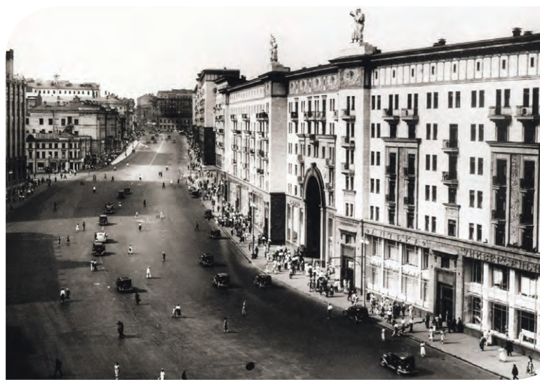
Улица Горького, 1934 год