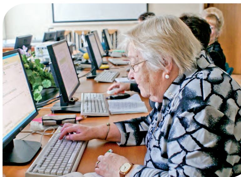
В классе компьютерной грамотности

Кроме того, у филиала сложилось содружество с физкультурно-оздоровительным Центром Роналда Макдоналда, который работает на территории Олимпийского учебно-спортивного центра «Крылатское». Центр Роналда Макдоналда еженедельно оказывает услуги по социальной реабилитации маленьким посетителям ОСРДИ. Ребята доставляют специальным автобусом, с ними занимаются лечебной физкультурой, к их услугам предоставляют компьютерный зал, кабинет психолога, помощь социального педагога. На занятиях всегда присутствуют сотрудники ОСРДИ. Это дает им возможность перенимать новые модели организации работы с такими детьми, делиться опытом. Совместно с филиалом Центр Роналда Макдоналда проводит спортивные мероприятия, участвует в праздниках, организует вручение призов и подарков. У сотрудников Центра принципиальная позиция: каждый ребенок должен уйти отсюда счастливым, с улыбкой. После занятий у детей выравнивается