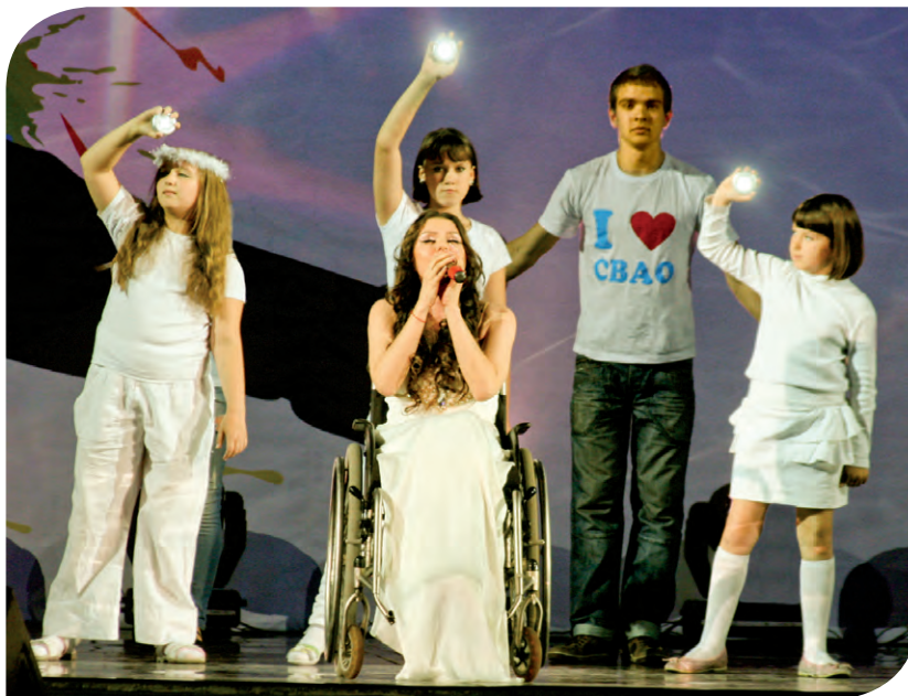
Композиция «Открой свое сердце» в исполнении команды «Хэдвэй» (СВАО)

Представители Юго-Восточного округа предварили свое выступление девизом: «Нам, молодым, все