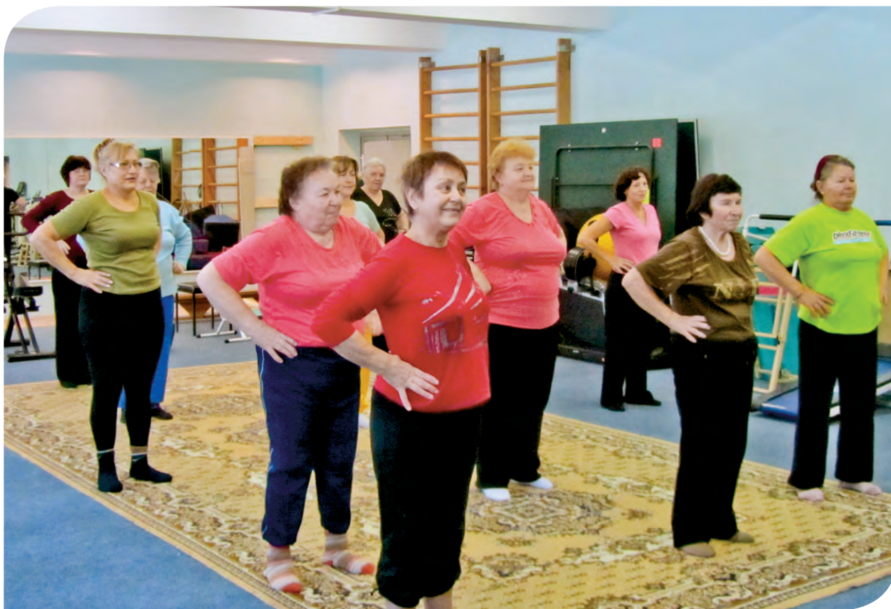
Движение – жизнь!