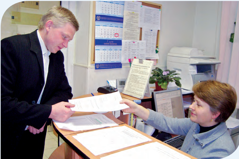
Запись на прием

газеты Восточного округа и наткнулась на скромное объявление о том, что жители нашего округа могут воспользоваться услугами Московской службы психологической помощи. В объявлении были указаны адрес и телефон.