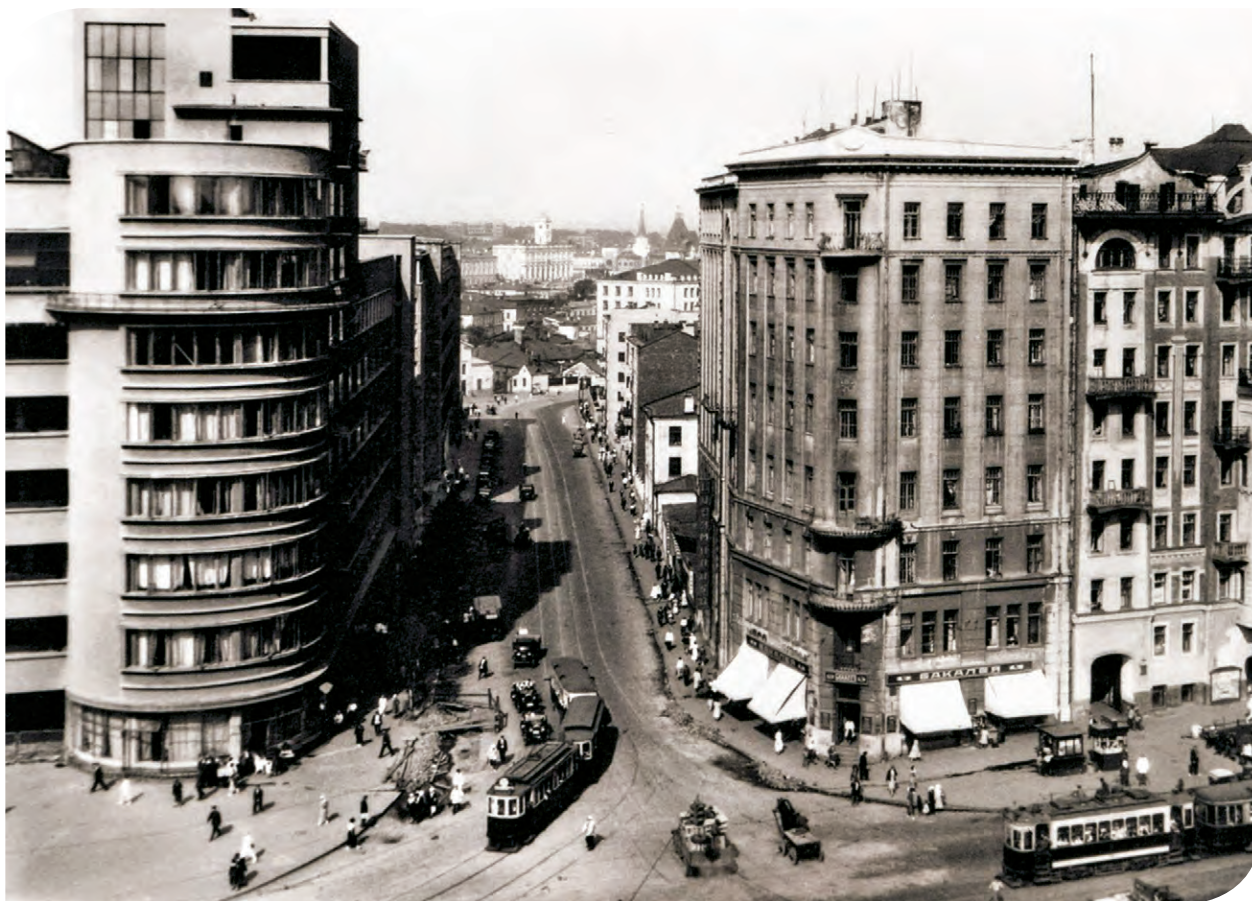
Орликов переулок, 1937 год