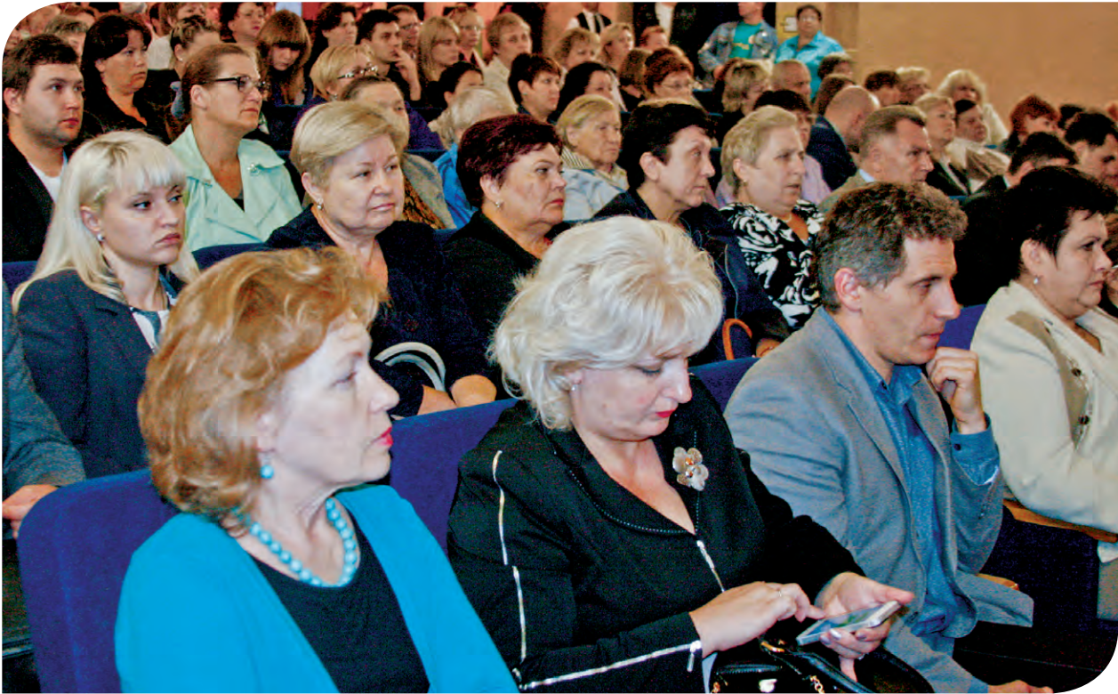
На встрече с жителями Троицкого и Новомосковского административных округов