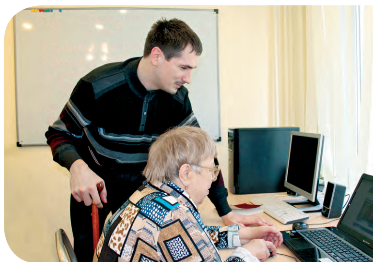
Повышение компьютерной грамотности

В течение 30-дневного курса на дневном стационаре в ТЦСО можно заниматься в разнообразных