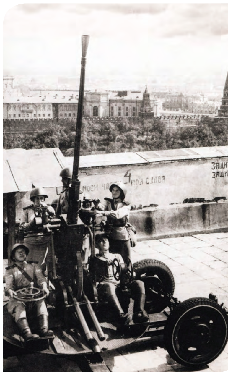
Оборона Москвы, 1941 год

Вот его фотовзгляд на Калужскую площадь 1931 года. Плавная линия трамвайных путей и круглая площадь, над которой возвышается храм, создают впечатление, что город словно растекается в разные стороны. Совсем иной образ проступает на снимке ЦПКиО имени М. Горького. Неторопливый, как река, спокойный, как набережная, сюжет наполнен динамикой. Четыре идущие девушки в фотокадре оказались точно посередине, между двумя скульптурами, украшающими набережную. Прогулочный теплоход на втором плане уходит в противоположном направлении. Движение уравновешено ровной линией многоэтажных домов на противоположной стороне Москвы-реки. Снимок выстроен на столкновении