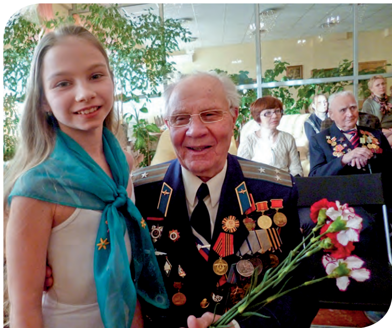
Школьники поздравляют ветеранов с Днем Победы

– В 2013 году мы провели опрос инвалидов I группы и II группы 3-й степени. Сотрудниками центров социального обслуживания совместно с представителями общественных организаций опрошено 1229 человек. Выявлены нужды в реабилитационных услугах, социальной помощи, в том числе мобильной, товарах длительного пользования. Составлена программа адресной социальной помощи. На сегодняшний день нуждаемость почти удовлетворена. Только шесть человек по состоянию здоровья не могут сейчас пройти